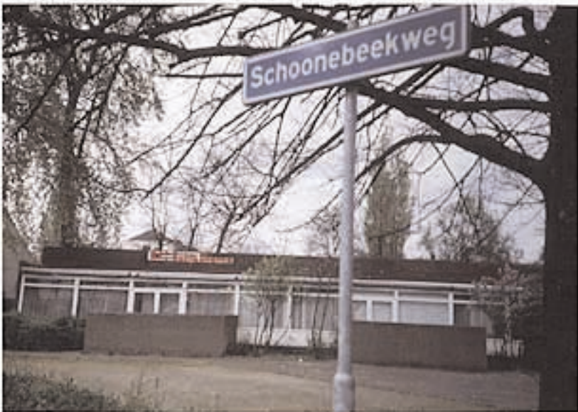
mfc satya dharma